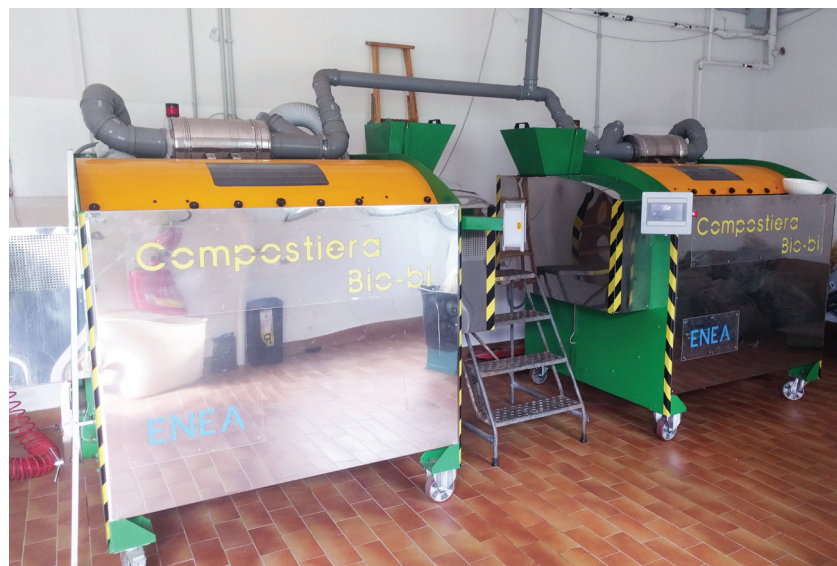
Fig. 2 Compostiera di comunità a doppia camera

Il processo di sviluppo della rigenerazione urbana in senso smart non può procedere simultaneamente su tutta la città, poiché il problema è molto complesso sotto diversi punti di vista (tecnologico, sociale, economico, politico) e richiede una roadmap per passi, che qualifichi