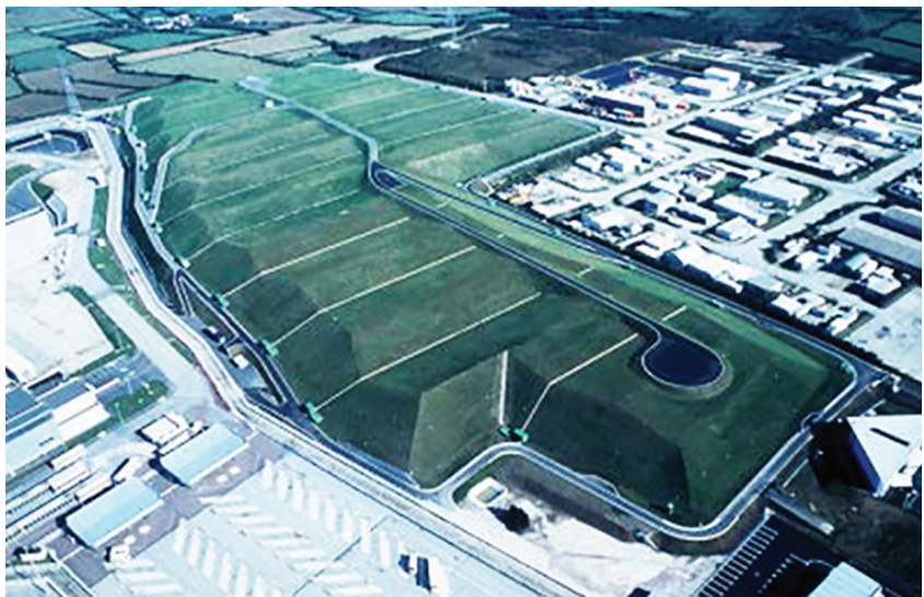
Fig. 2 Deposito di superficie francese di La Manche per 500 mila metri cubi

i rifiuti radioattivi. Come già menzionato, a valle della consultazione si chiuderà il processo di VAS entro il quarto trimestre del 2017 e sarà adottato definitivamente il Programma, con Decreto del Presiden-