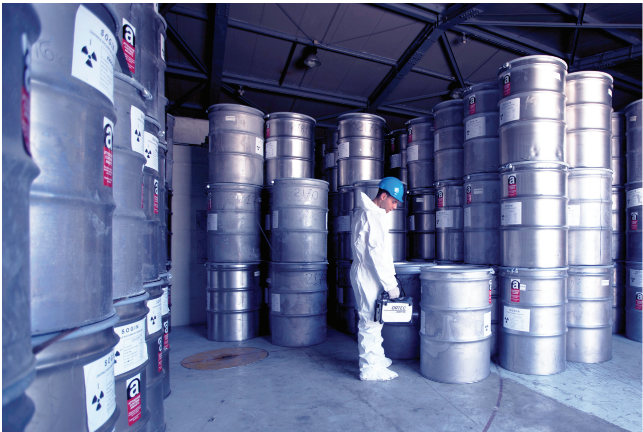
L'interno di un deposito temporaneo dei rifiuti radioattivi

Nelle more di tale articolazione temporale si è nel frattempo evi-