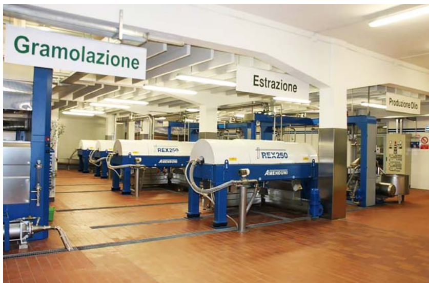
Sala macchine dell'Oleificio Sociale Cooperativo di Canino

tecniche alternative di controllo dei parassiti.