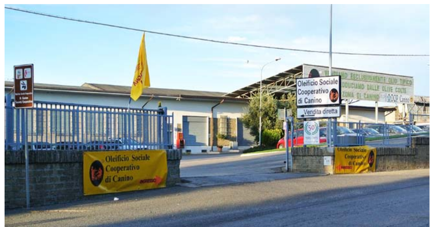
Sede dell'Oleificio Sociale Cooperativo di Canino

La sperimentazione sul campo, per mettere a punto un modello previsionale di controllo della mosca dell'olivo, prevedeva una serie di rilievi a cadenza settimanale su aziende pilota effettuati da personale tecnico che provvedeva al rilevamento delle catture e dei dati climatici e al prelievo e all'analisi dei campioni di olive.