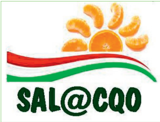
Figura 2 Logo del Progetto SAL@CQO

A che cosa serve? Innanzitutto è stato lo strumento di riferimento per la rivelazione di vari adulteranti richiesti dal progetto. Inoltre, rappresenta la base di partenza per lo sviluppo di un secondo prototipo compatto e trasportabile. Per motivi pratici, SAL@CQO ha concretizzato la ricerca su alcuni temi specifici,