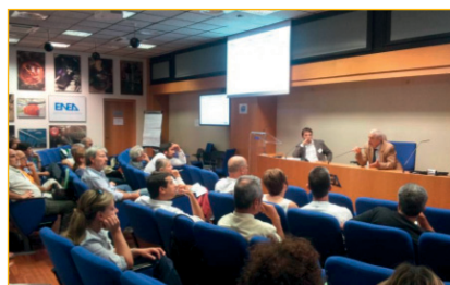
FIGURA 3 Focus group di Roma: sessione plenaria