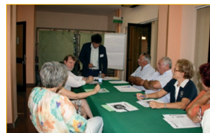
FIGURA 4 Focus group di Gubbio: gruppo post-famiglia