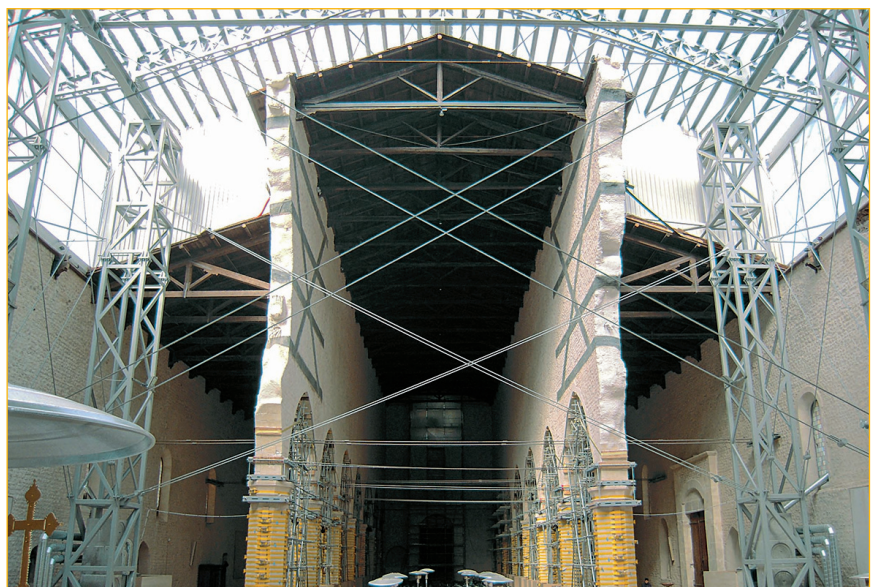
FIGURA 2 L’Aquila: Basilica di Santa Maria di Collemaggio