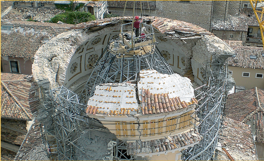
FIGURA 3 L'Aquila: Chiesa di Santa Maria Suffragio