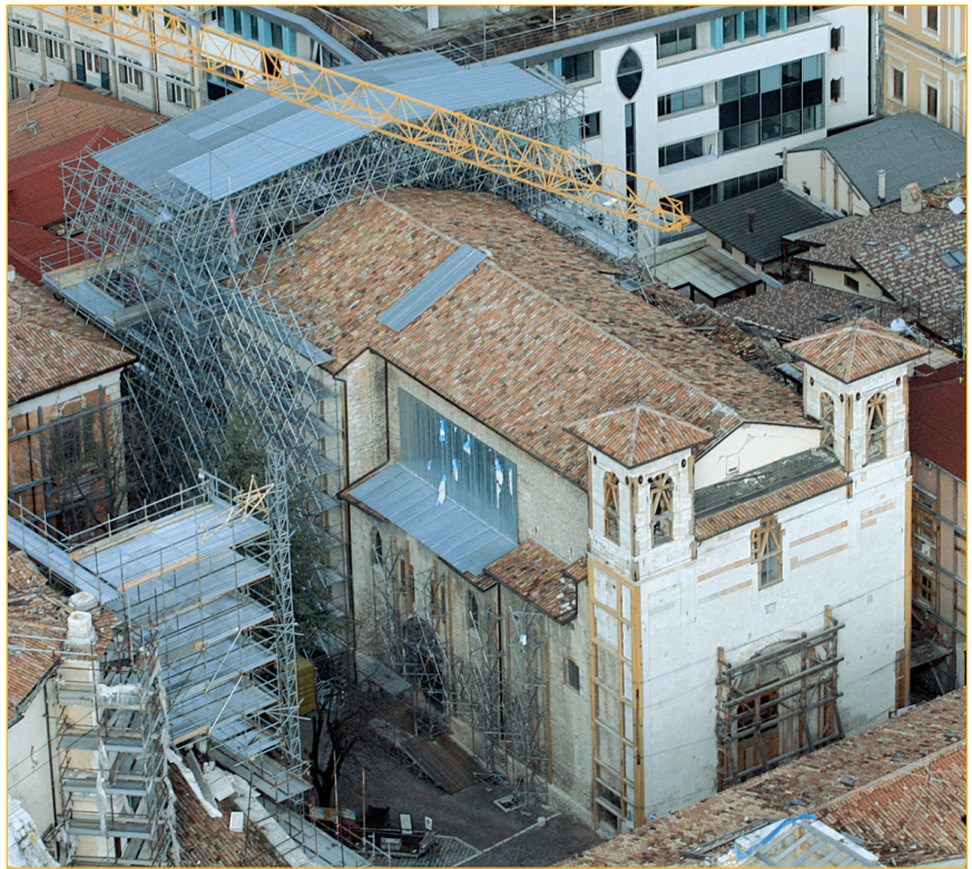
FIGURA 1 L’Aquila: messa in sicurezza della Chiesa di San Marco

Il risultato finale è stato un sistema di messa in sicurezza diffuso e non invasivo, che permetterà di eseguire le successive opere di restauro previa adeguata riflessione e disponibilità di tempo, consentendo nel frattempo la percorribilità delle strade e l’agibilità di un certo numero di esercizi pubblici, e quindi in definitiva di vivere in maniera diretta e relazionale parte del centro storico. Il lavoro provvisorio nel centro storico dell’Aquila e negli altri paesi del cratere sismico è stato un impegno senza precedenti nello scenario nazionale dei beni culturali, tradottosi nella messa in sicurezza di un numero elevatissimo di beni architettonici e mobili, gran