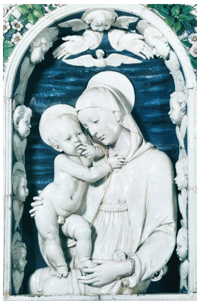
Fig. 2 Andrea Della Robbia, Madonna del cuscino (1475 circa). Palermo, Galleria Interdisciplinare Regionale della Sicilia – Palazzo Abatellis [su concessione del Ministero per i Beni e le Attività Culturali e del Turismo – Opificio delle Pietre Dure di Firenze – Archivio dei restauri e fotografico]

ne scoperto come elemento chimico, in coincidenza con la nascita della chimica come disciplina scientifica moderna; si è scelto pertanto di non addentrarsi nell'epoca industriale, durante la quale si assiste comunque ad ulteriori sviluppi nella tecnologia associata al cobalto.