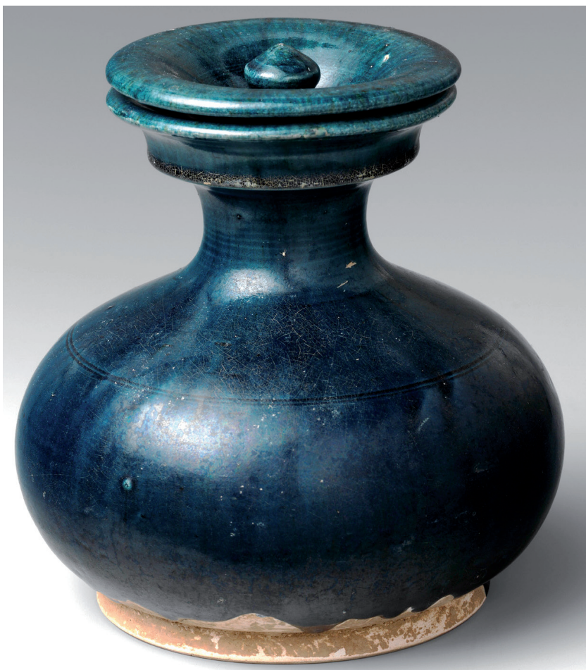
Fig. 1 Vasetto con coperchio, Cina, dinastia Tang (618-907 d.C.), VII secolo, terracotta con invetriatura blu al cobalto. New York, The Metropolitan Museum of Art, Accession Number: 2006.520.a,b [ www.metmuseum.org ]

Il cobalto è stato utilizzato per colorare i vetri nell'antichità, ad esempio