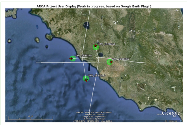
Figura 6 Simulazione di quattro UAV in rotte di collisione controllate e risolte dall'algoritmo del sistema

In tale contesto, il Laboratorio di Robotica dell'Unità Tecnica Tecnologie Avanzate per l'Energia e l'Industria dell'ENEA, nell'ambito di una serie di progetti europei e regionali (MACRO, EUROSTARS ARCA, SARA), in collaborazione con partner industriali, quali Deep Blue Srl e SpaceTech GmbH, ha realizzato un sistema (hardware e software) prototipale, alloggiabile a bordo di un UAV, in grado di far fronte, in modo semiautomatico, a possibili eventi di collisione tra aeromobili, anche in caso