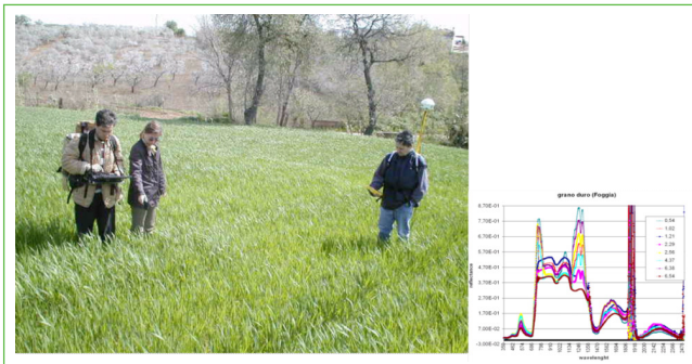
Figura 2 Rilevazione di misure spettrali di calibrazione relative a piantagioni di grano duro su suoli a diverso grado di salinizzazione tramite radiometro iperspettrale portatile ASD-FieldspecPro col supporto di ricevitore GPS per la georeferenziazione

Queste misure di campo, opportunamente georeferenziate, possono fornire la calibrazione puntuale, efficace per sviluppare metodologie integrate di telerilevamento multipiattaforma (satellite, aereo, UAV), in grado di soddisfare le esigenze dell'agricoltura di precisione, in termini di monitoraggio ripetitivo e mappatura degli stress e danni alle colture (Figura 3), derivanti dai fattori sopra citati sin dalle fasi iniziali.