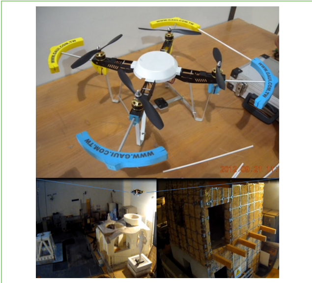
Figura 5 Utilizzo di UAV ad ala rotante ed alimentazione elettrica per il monitoraggio dei beni culturali e l'ispezione di edifici e infrastrutture danneggiate da eventi sismici e catastrofici

fronte adeguatamente ad eventi improbabili e a situazioni potenzialmente dannose.