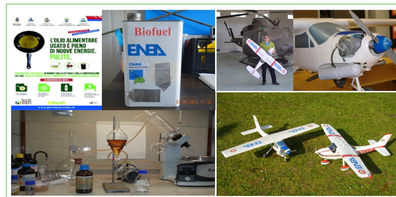
Figura 4 Messa a punto e test di motorizzazioni aeronautiche innovative di UAV per lo sfruttamento di combustibile aeronautico ottenuto da biodiesel derivato dal riciclo di olii alimentari esausti

Attualmente, nel settore degli APR, in sintonia con la crescita dell'interesse generale, diverse attività di ricerca si stanno sviluppando significativamente, in sinergia tra le varie competenze multidisciplinari presenti nell'Agenzia, come queste applicazioni specifiche richiedono. Con riferimento al settore delle piattaforme UAV ad ala fissa, si stanno sperimentando con successo motorizzazioni innovative a supporto dell'utilizzo di biocombustibili, ottenuti dal riciclo degli olii alimentari esausti come carburanti aeronautici (Figura 4), mentre per quelli ad ala rotante è in corso la progettazione per utilizzare celle a combustibile a idrogeno con cui superare i limiti di autonomia (0,5-0,75 h) delle soluzioni APR maggiormente diffuse, e con emissioni a impatto nullo.