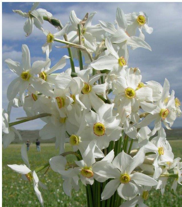
Figura 4 Narciso

Molecole di forte interesse possono essere contenute anche in scarti agro-industriali quali bucce e semi di pomodoro (Figura 6) da cui si può estrarre il licopene, un carotenoide che mostra un elevato potere antiossidante, in virtù della sua struttura achilica, del numero di doppi legami coniugati e della sua elevata idrofobicità. In generale i carotenoidi sono efficaci antiossidanti, grazie alla loro azione di scavenger di radicali liberi. Tra i carotenoidi il licopene sembra essere il più efficiente oxygen quencher , grazie alla presenza di due ulteriori doppi legami rispetto alla struttura degli altri carotenoidi. Il licopene, come altri carotenoidi, ha attività di prevenzione dei tumori, in particolare quello della prostata. Da una semplice estrazione SFE, senza dover ne-