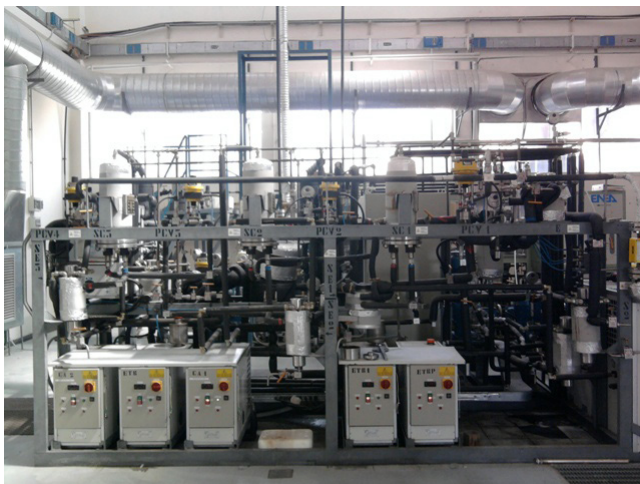
Figura 3 Impianto pilota Luwar

L'uso dell'impianto pilota Luwar (Figura 3), dotato di tre separatori in serie, ha inoltre permesso di arrivare ad una formulazione maggiormente pura dell'estratto finale grazie alla separazione della frazione oleosa dalla frazione cerosa co-estratta.