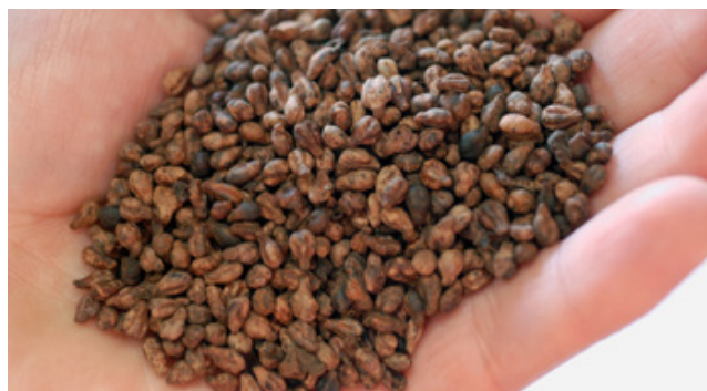
Figura 2 Vinaccioli essiccati

L'Organizzazione Mondiale della Sanità (OMS) da anni raccomanda l'assunzione di omega 6 e omega 3 in rapporto da 3:1 a 5:1. L'olio di semi di canapa, come l'olio di pesce, contiene naturalmente omega 6 e omega 3 nel rapporto ottimale di 3:1 e la sua assunzione non ha controindicazioni. L'olio di canapa contiene, inoltre, tocoferoli ( \alpha -, \beta -, \gamma -, \delta -tocoferolo e plastochromanolo-8 (P-8), un derivato di \gamma -tocotrienolo), sostanze ad attività antiossidante che agiscono impedendo l'ossidazione degli acidi grassi insaturi e che riducono il rischio di malattie cardiovascolari. L'estrazione di olio dai semi di Cannabis sativa è generalmente eseguita con sistemi di spremitura a freddo o impiegando solventi organici con fattori limitanti, legati sia al recupero della frazione oleosa che alla sostenibilità ambientale. In tal senso, il Laboratorio UTAGRI-INN ha svolto lavori di ricerca e sviluppo sull'estrazione di tali oli con SFE, dimostrando che tale tecnica estrattiva le ha rese comparabili con le tecniche tradizionali e, a determinate condizioni operative, prodotti finali con maggiore stabilità ossidativa.