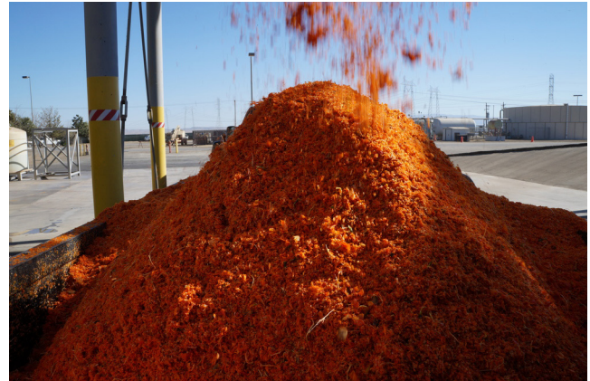
Figura 6 Bucce e semi di pomodoro

Possibili future attività del Laboratorio UTAGRI-INN nel campo dell'estrazione di biomolecole di interesse, potranno riguardare l'estrazione di astaxantina dall' Haematococcus pluvialis , una microalga verde appartenente alla classe Clorofyceae. L' Haematococcus pluvialis