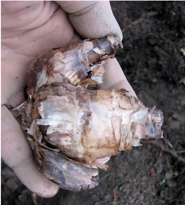
Figura 5 Bulbo del narciso

cessariamente fare ricorso ad una separazione frazionata, si ottiene una miscela di composti naturali in cui, oltre al licopene, sono presenti antiossidanti, vitamine, amminoacidi ed altre sostanze, molto importanti per la salute umana.