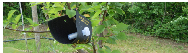
Figura 2 Supporto mobile di concentrazione delle ovo deposizioni di un predatore di fitofagi di colture arboree

sono stati messi a punto negli ultimi anni nei nostri laboratori, dimostrando come tale approccio possa essere efficace per il controllo del danno provocato da tale insetto e come ciò possa essere trasferito alla gestione preventiva del danno provocato da altri organismi animali e vegetali che, provenendo da altre zone del mondo, colonizzano il territorio nazionale senza trovare antagonisti naturali, in programmi di gestione ad ampio raggio (area-wide program).