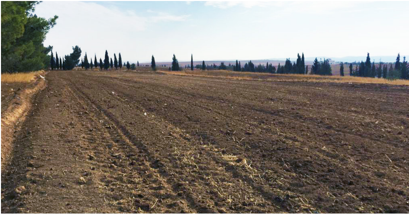
Fig. 2 Preparazione del campo sperimentale nella stazione agronomica di Al-Gweir (Giordania) per la coltivazione di orzo sostenuta da microrganismi autoctoni, promotori della crescita delle piante

commercio dei Prodotti Fitosanitari (PF) [6,7]. In Italia, il Ministero della Salute autorizza la commercializzazione dei PF attraverso il proprio Comitato Consultivo dei PF nel quale è presente anche ENEA. La regolamentazione dell'uso dei pesticidi a livello Europeo fa capo alla dir.128/2009/CE sull'uso sostenibile dei PF. Parte centrale della direttiva è la stesura di un Piano d'Azione Nazionale (PAN) che deve redigere ogni Stato Membro. In Italia la stesura del PAN è realizzata dal Consiglio tecnico-scientifico del PAN, al quale ENEA partecipa, istituito presso il MIPAAF. Inoltre, nell'ambito del protocollo d'intesa con il MATTM, l'Agenzia sta realizzando la piattaforma informativa SIF (Sistema Informativo Fitosanitari) [8], con l'obiettivo di fornire a Regioni, Province Autonome ed enti gestori delle aree naturali protette, un utile strumento di supporto per operare scelte consapevoli nelle strategie di difesa fitosanitaria delle colture attraverso l'utilizzo di informazioni e valutazioni su tossicità, ecotossicità e destino ambientale delle sostanze fitosanitarie, in linea con le richieste della Direttiva 2009/128/CE. SIF, sviluppato con tecnologia Microsoft