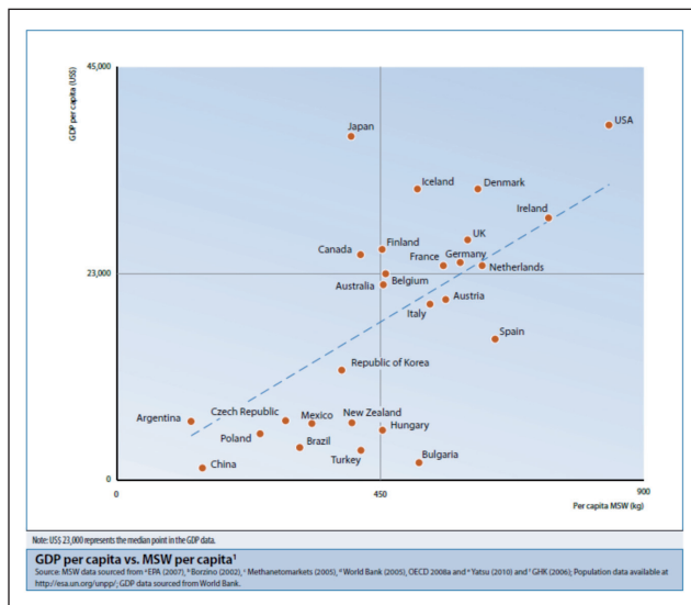
FIGURA 2 Relazione tra Reddito (PIL pro capite) e produzione di rifiuti (kg di rifiuti pro capite)

Le politiche per i trasporti prevedono il passaggio a modi di trasporto più ecologici, come trasporti collettivi e non-motorizzati per i passeggeri, e al trasporto ferroviario, fluviale e marittimo per le merci, il mi-