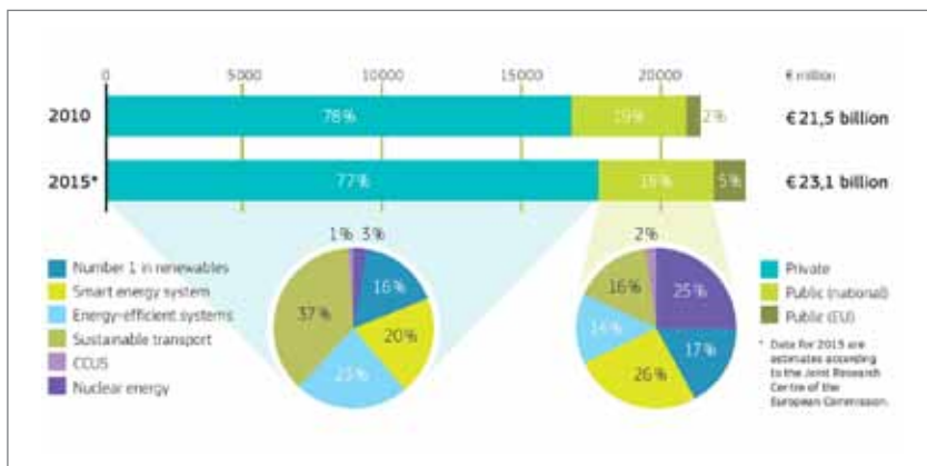
Fig. 2 Investimenti nelle priorità R & I EU/SET Plan negli anni 2010-2015

Nota: i dati per il 2015 nazionali e privati sono stime