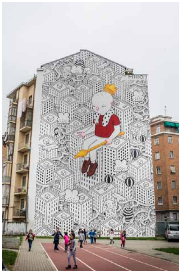
Fig. 3 Realizzazione di Millo, artista vincitore con il progetto Habitat del bando B.ART – Arte in Barriera

Alla base di molte delle iniziative avviate vi è il Programma URBAN, Progetto Integrato di Sviluppo Urbano dal quale nasce l'esperienza di Open Incet. Il Programma ha visto un investimento di oltre 30 milioni di euro, è stato redatto dalla Città di Torino e finanziato, per 20 milioni di euro, dalla Regione Piemonte mediante la gestione dei Fondi europei Por Fesr 2007-2013 e, per la restante parte, da fondi comunali o provenienti da ulteriori accordi con Stato e Regione per la realizzazione di interventi specifici. Oltre a Open Incet, Urban Barriera ha realizzato il parco urbano Aurelio Peccei , recuperando gli spazi delle vecchie