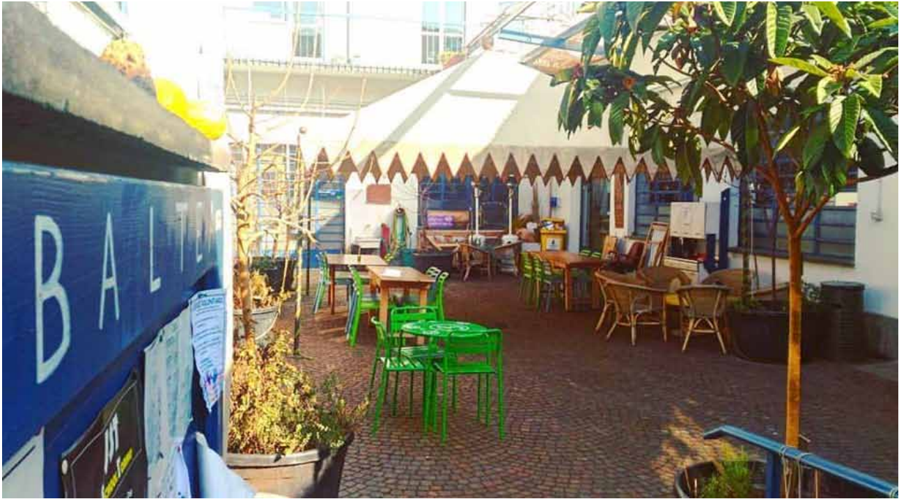
Fig. 2 Una immagine del centro polifunzionale Via Baltea/Laboratori di Barriera

attraverso un bando del Comune di Torino per la realizzazione di un Centro di Open Innovation vinto da un raggruppamento temporaneo di impresa 1 .